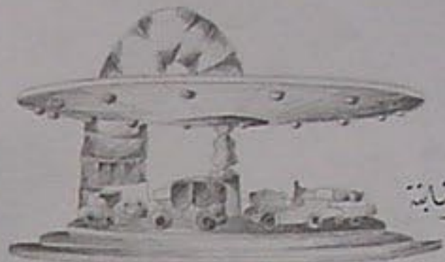
السبيل في النابتة