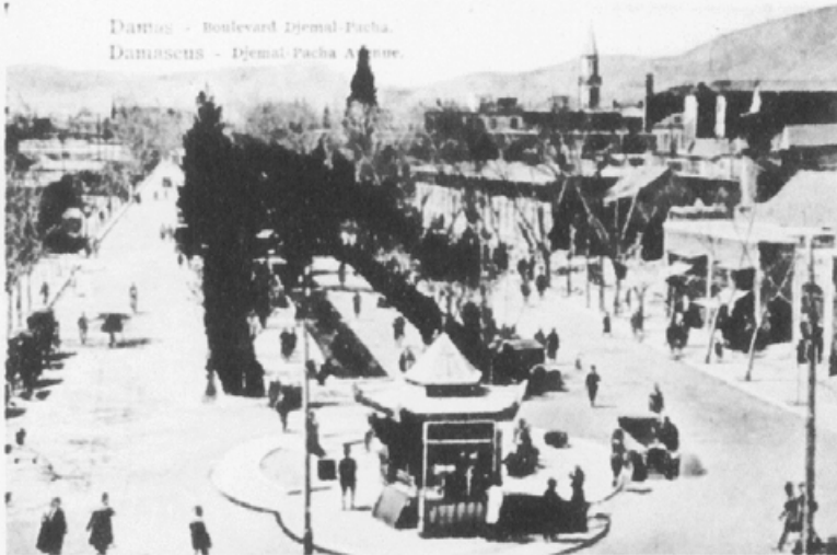
Damas - Boulevard Djemal Pacha. Damascus - Djemal Pacha Avenue.